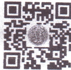
สาขา ปราชญ์เกษตรเศรษฐกิจพอเพียง