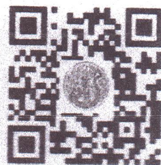
สาขา ปราชญ์เกษตรผู้นำชุมชนและเครือข่าย