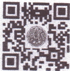
สาขา ปราชญ์เกษตรดีเด่น