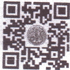
สาขา ปราชญ์เกษตรผู้ทรงภูมิปัญญาและมีคุณูปการต่อภาคการเกษตรไทย